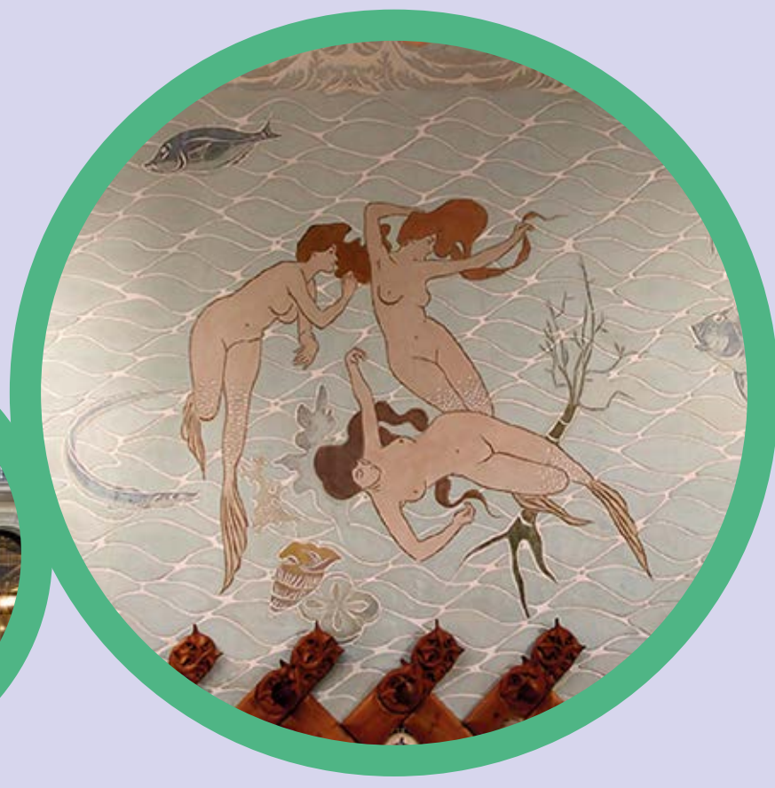
Sala de les Sirenes Fonda Espanya Barcelona