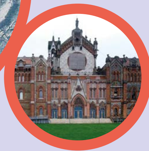
Porta Sant Jordi Universitat de Comillas Comillas (Santander)