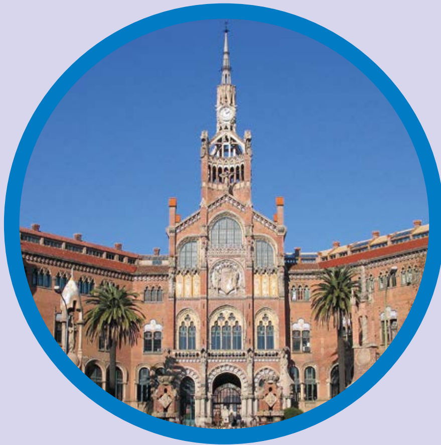
Hospital de Sant Pau Barcelona

Lluís Domènech i Montaner va ser un dels arquitectes més importants del Modernisme català i el responsable de projectar el Palau de la Música Catalana, l'únic auditori del món declarat Patrimoni Mundial per la UNESCO. ¿Sabies que aquests altres espais també són obra de Lluís Domènech i Montaner?