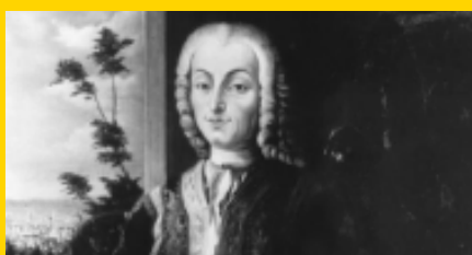
Bartolomeo Cristofori (1655-1731)